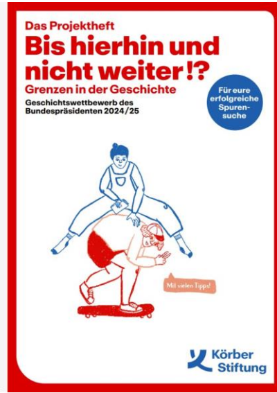
Projektheft für Schüler:innen